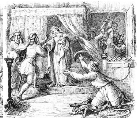
Ill. per Fratellino e sorellina : Otto Speckter (1807-71), dodici disegni predisposti per un'edizione inglese della fiaba, apparsi nel 1842 in Inghilterra in litografie.